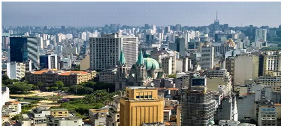
Foto atual da cidade de São Paulo.