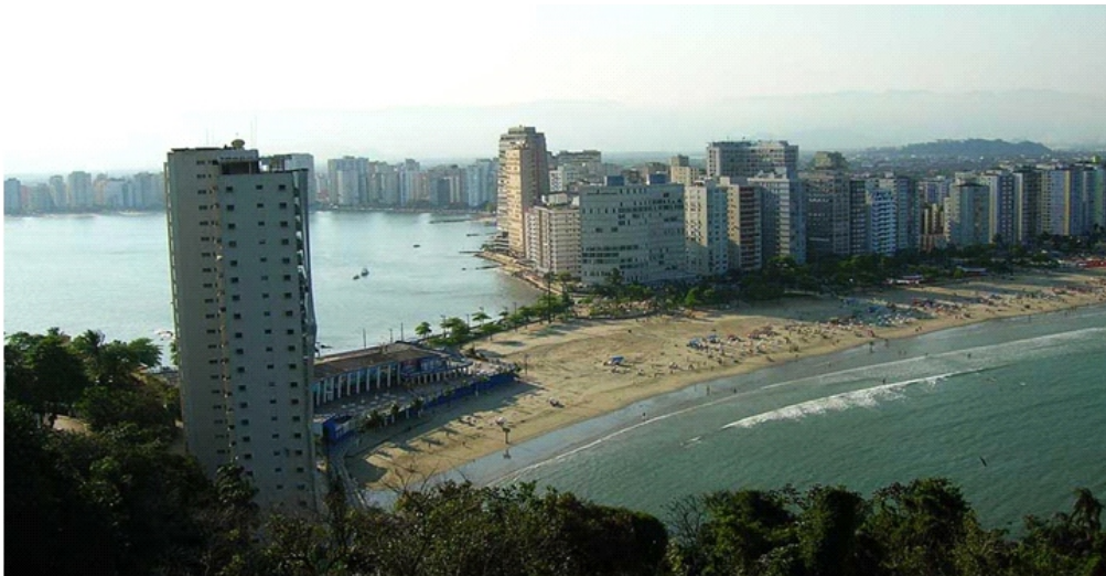
Foto atual da cidade de São Vicente, São Paulo.

1. Observe as imagens atuais das cidades citadas no texto acima.